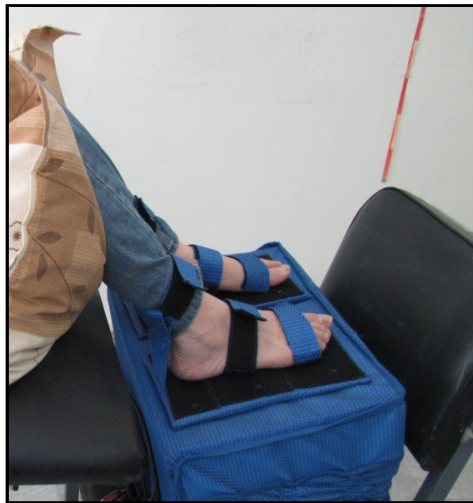
شکل ۲- وضعیت بیمار هنگام اعمال ارتعاش

که بیمار نسبت به قبل از مداخله، مونوفیلانمان نازک‌تری را حس کرد. در انگشت کوچک، حس بیمار در محدوده طبیعی بود و بعد از مداخله تغییری نداشت. در نقطه داخلی سینه پای بیمار، حس کف پا یک درجه کاهش نشان داد و حس نقطه خارجی سینه پا در وضعیت طبیعی خود باقی ماند. در قسمت داخلی کف پا، حس بیمار با یک درجه کاهش پس از مداخله، همچنان در محدوده طبیعی قرار داشت. حس نقطه خارجی کف پا پس از مداخله، با یک درجه بهبودی به محدوده کاهش لمس ظریف رسید. در مورد پاشنه نیز حس کف پا بدون تغییر باقی ماند. در کل پس از مداخله، از هفت نقطه مورد بررسی در کف پای بیمار، حس سه نقطه بدون تغییر باقی ماند. حس دو نقطه بهبود یافت و دو نقطه نیز کاهش نشان داد.